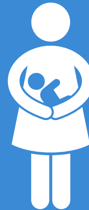
CRIANÇA DE COLO